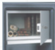
Equipements intérieurs (en partant de la gauche) : tablette, armoire à clé